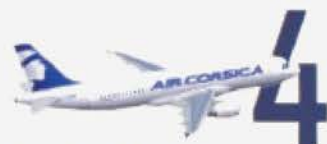
AIRBUS A320ceo Capacité 180 sièges