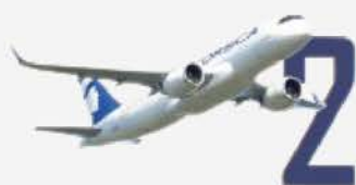
AIRBUS A320neo Capacité 186 sièges

Avec 46% du trafic annuel (85% l'hiver) au départ et à destination des quatre aéroports de la Corse (Ajaccio, Bastia, Calvi et Figari), Air Corsica est aujourd'hui le premier transporteur aérien de l'île. L'activité quotidienne varie de 60 à 100 vols par jour selon les saisons .