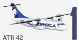
ATR 42 Capacité 48 sièges