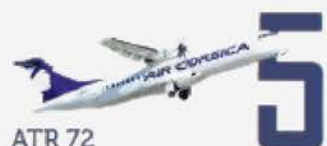
ATR 72 Capacité 70 sièges